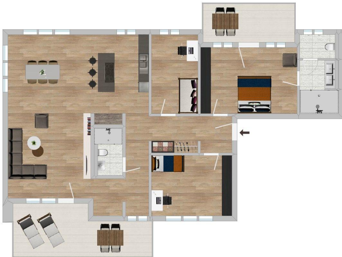
Grundriss Wohnung 4